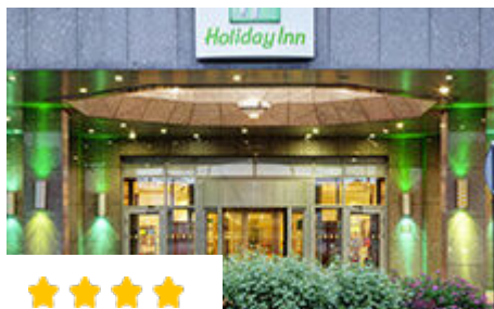
★★★★★ Отель Holiday Inn Москва Сокольники